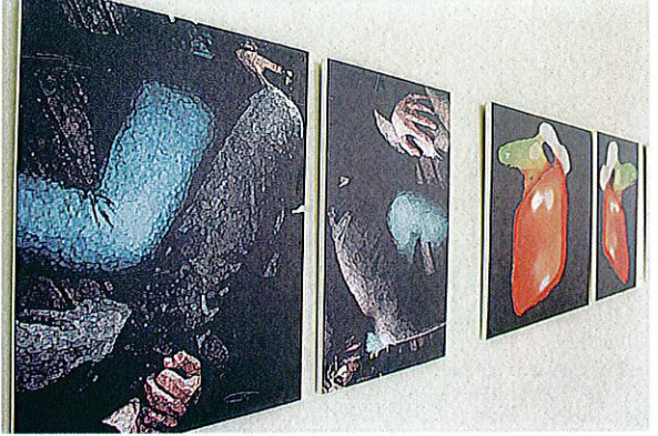
Evaldas Snieškus kviečia žvelgiant į nuotraukas kažką pamatyti jų viduryje ir patiems sugalvoti pavadinimus.